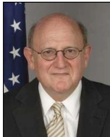
Ira Forman, különmegbízott

Istentiszteletünkön nem hivatalos látogatást tett Ira Forman , az Egyesült Államok Külügyminisztériumának az antiszemitizmus leküzdésével foglalkozó különmegbízottja, illetve M. André Goodfriend , az Egyesült Államok Budapesti Nagykövetségének ideiglenes ügyvivője.