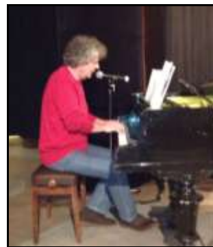
Dés László fellépése igazi meglepetés volt!