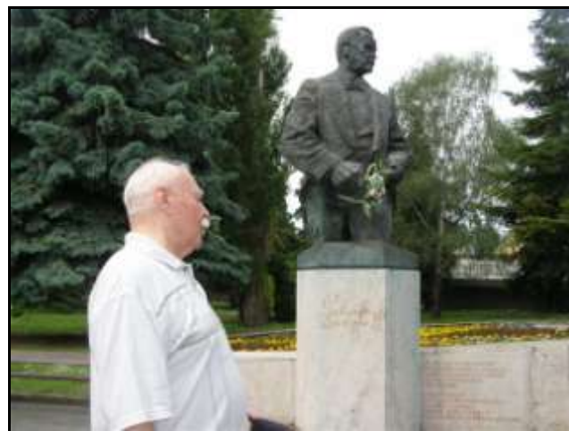
A város szülőtte, Lehár Ferenc szobra

Szombat délelőtt körülnéztünk a városban. Abban a szerencsében volt részünk, hogy a sétát a legkiválóbb szakértő, Mácza Mihály történész vezette, aki négy évtizede kutatja Komárom és vidéke történelmét, művelődés-, ipar- s településtörténetét.