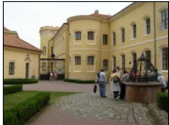
Selye János Egyetem

A tér nyugati oldalán a Zichy Palota áll. A közelben az egykori Tiszti Pavilonban kapott helyet a Selye János Egyetem központja. Ez az első önálló magyar nyelvű egyetem Szlovákiában, amely 2004 szeptemberében kezdte meg működését. Három kara van: a Teológiai, a Gazdaságtudományi és a Tanárképző Kar. A Református Teológiai kar az 1994-ben alapított Calvin János Teológiai Akadémia integrálásával jött létre, a Gazdaságtudományi Kar pedig eredetileg a Corvinus Egyetem kihelyezett kara volt.