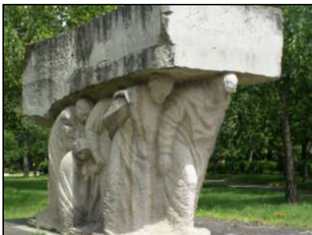
A meghurcoltak emlékműve: „In memoriam 1944-1948”