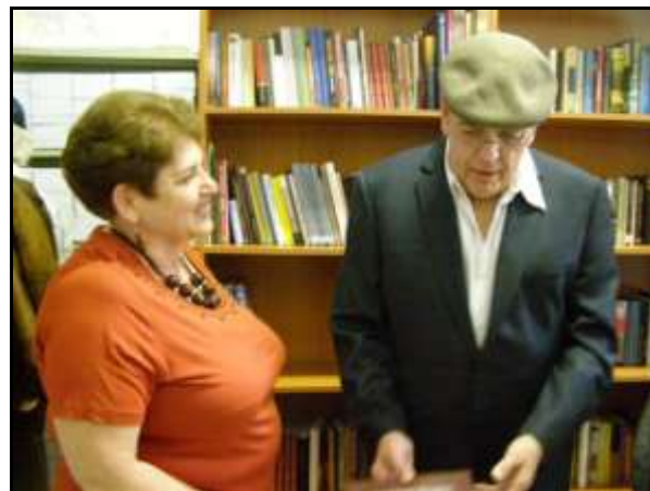
Ismerkedünk a hitközség könyvtárával

Mint mondta, az amerikai reform zsidóság egyik legnagyobb teológusa, Kaufmann Kohler (1843-1926) szerint a zsidóságnak olyannak kell lennie, mint „Isten élő vízzel telt patakja”.