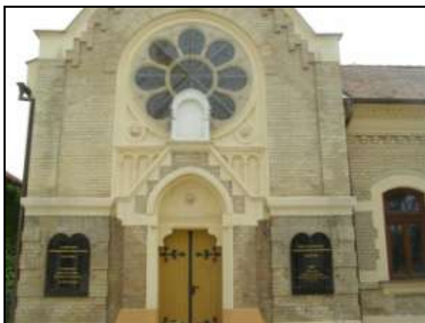
Az úgynevezett kis zsinagóga a hitközség székházában

A Hitközség a jelenlegi Kulturális és Közösségi Központját még 2000 szeptemberében hozta létre az egykori zsidó Menház épületében, amit 1896-ban avattak fel. Itt található az úgynevezett kis zsinagóga, amely a háború előtti három templomból egyedül maradt meg. A neológ nagyszinagógát és az ortodox zsinagógát a hitközség kénytelen volt eladni.