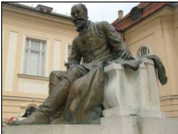
A Jókai szobor

Előtte áll a város szülötte, Jókai Mór szobra, Berecz Gyula komáromi szobrászművész alkotása.