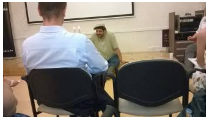
Közreműködött Vári György irodalomtörténész és