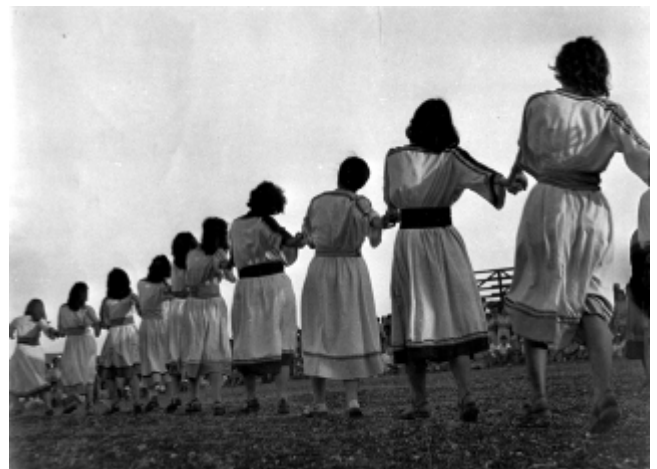
Tu B'Av-i tánc Kibbutz Ein HaShofet-ben 1944-ben

Az ünnep említése a Misnában található, eszerint az akkori örömnépe a szőlőszüret kezdetét jelezte, amely Jom Kippur-kor ért véget. Ekkoriban szokás volt, hogy a hajadon lányok fehér ruhába öltözve táncolni mentek ki a szőlőkertekbe.