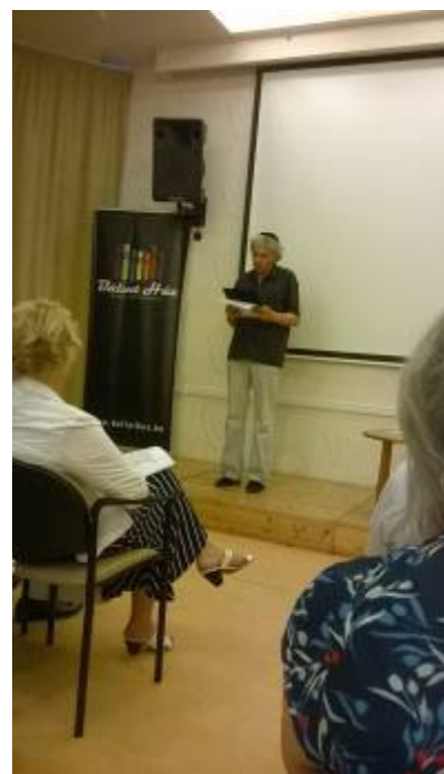
Garai Róbert színművész